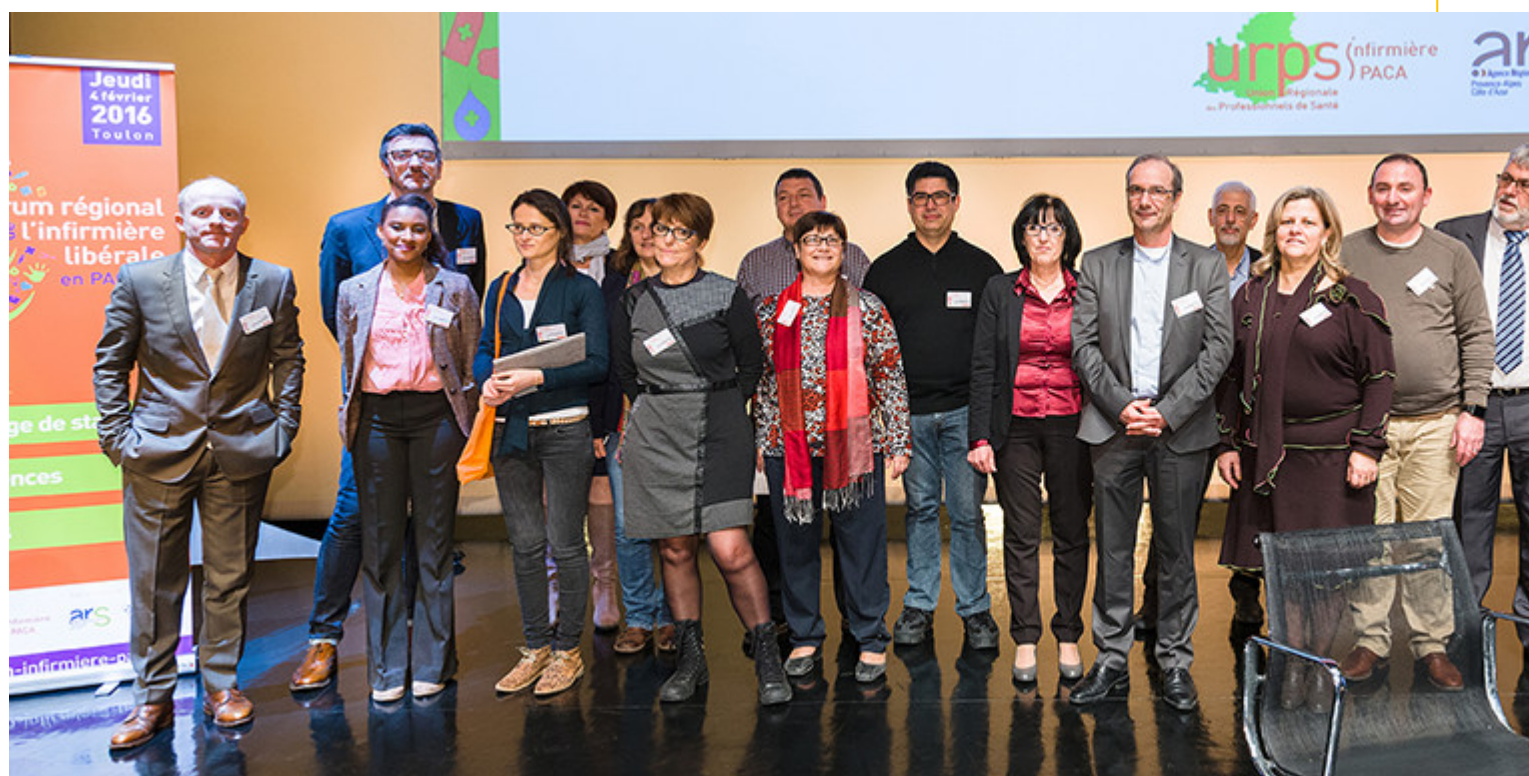
Equipe URPS infirmière PACA