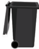
Poubelle à ordures ménagères